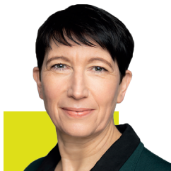
Silvia Bender Bundesministerium für Ernährung und Land- wirtschaft