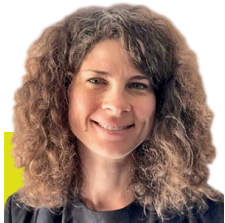
Rada Chehlarowa European Commission