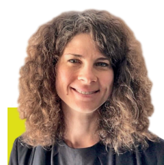
Rada Chehlarowa European Commission